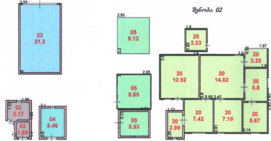
შენიშვნა 05 ავტოფარეხი მესაკუთრე ცხოვრობს № 27-ში