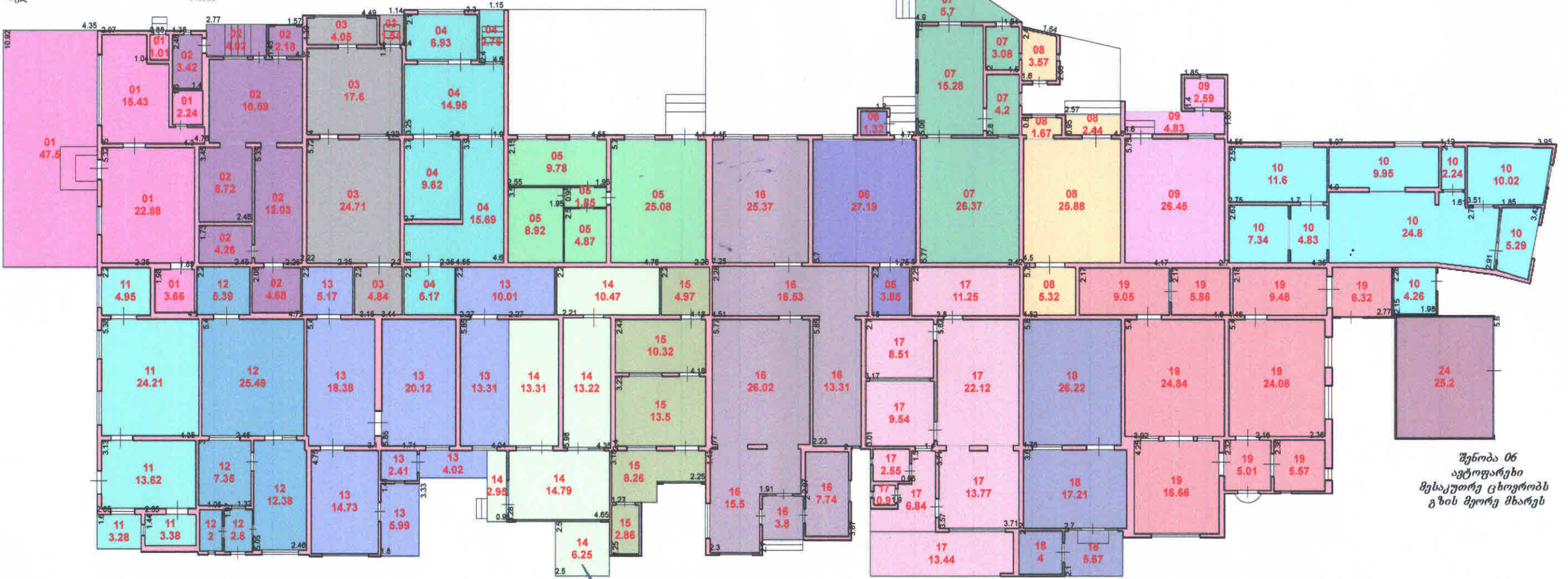
შენიშვნა 06 ავტოფარეხი მესაკუთრე ცხოვრობს გზის მეორე მხარეს